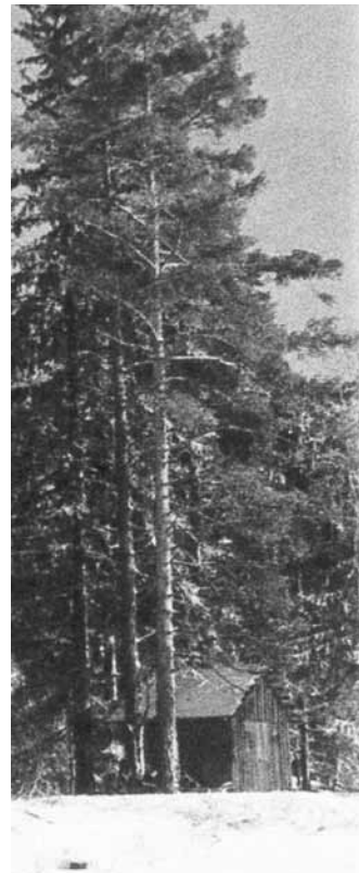
Kylän yhteinen palokaluustovaja

Kuutostien pohjaa tehtiin kylämme kohdalla 1950-luvun loppupuolella. Tien epätasaisella pohjalla oli joskus hankala kulkea, mutta sitä pitkin koulumatka lyheni puoleen. Kun puolivälissä olevaan puroon ei vielä ollut asennettu siltarumpuja, piti laskeutua puron reunaan ja keinotella sen yli sekä tietysti kiivetä taas ylös tielle.