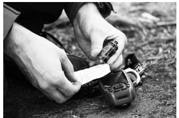
Joskus kätkö yllättää pienuudellaan.

Alkuun pääsee suomenkieliseltä sivustolta www.geocache.fi , vastaava ulkomainen sivusto on www.geocaching.com .