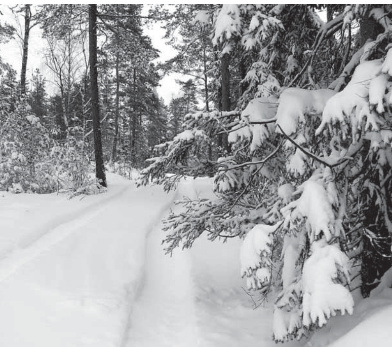
“Minkä helmi helpottaa, sen maaliskuu maksaa”