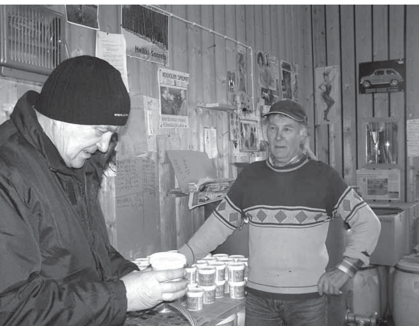
Saarelan Heikin hunajaa saa myös suoraan tilalta

Vaikka liito-orava on lainsäädännössä määritelty uhanalaiseksi, on se nykyään yleinen etelä-Suomessa. Yöllä ja hämärissä liikkuvana siitä ei usein onnistu kuitenkaan saamaan näköhavaintoa.