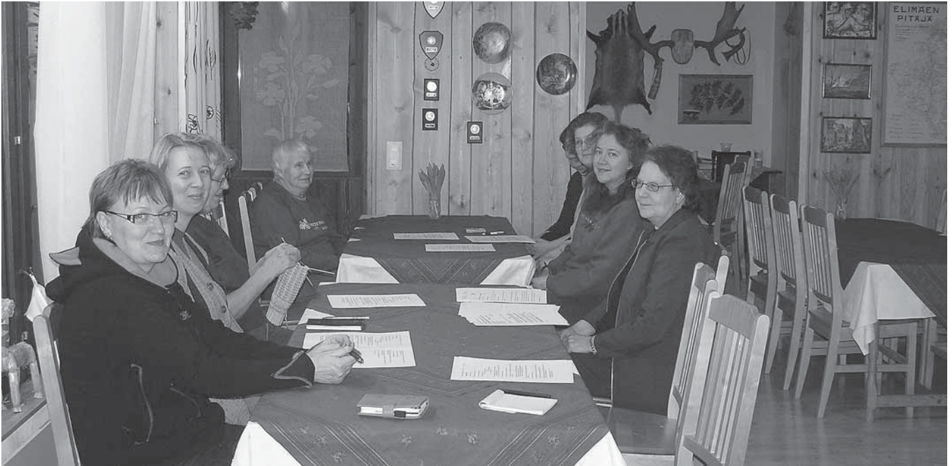
Niinimäen marttojen vuosikokous pidettiin Mikkilän tilalla