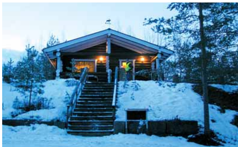
Maaliskuisen kuutamohiihdon aikaan oli sentään vähän lunta maassa

kautta. Tämä palvelisi etenkin kauempana asuvia, entisiä kyläläisiä, joita lehden jakelu ei muuten tavoita.