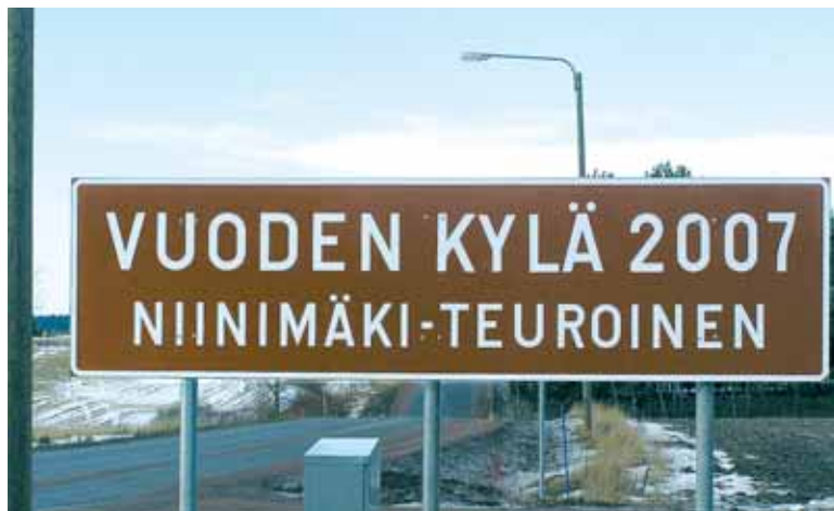
Uudet kyltit ovat ilmestyneet kyläkuvaan