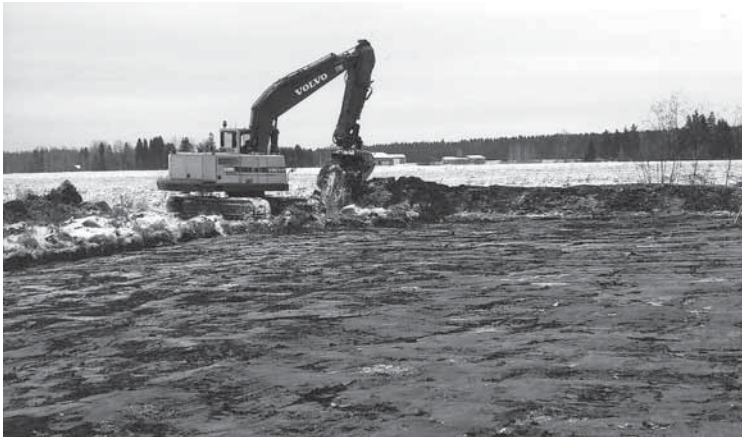
Tempon rakennuttama luistelualue (20x40 m) valmistui joulukuussa kylätalon pihapiiriin. Luistelemaan päästiin useita kertoja, vaikkakin lauha sää haitsasi jään kunnossapitämistä.

”Siel on jo auto, jättääkö ne nyt meijät?” Näillä sanoilla alkoi erään teuroisten martan musikaalimatka Imatralle. Oli lauanta kahdeksas maaliskuuta, Naistenpäivä, mutta ilma ei ollut kylläkään mikään tyyppillinen naistenilma. Tuulet ja tuiskuthan usein rinnastetaan naistenilmaksi. Nyt oli tyyntä ja selvää.