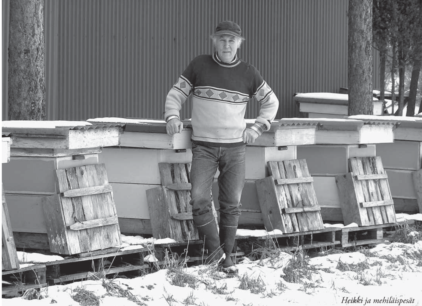
Heikki ja mehiläispesät