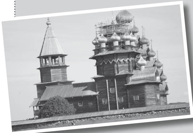
Kizhin saaren pienempi- eli alakirkko

Kizhin museosaari, se Unescon on aarre. Taitavaa puuarkkitehtuuria kirkon joka kaarre, Kaksikymmentäkolme kupolia auringossa kiiltää, ne tehty on päreistä, kaunista, ihan sydäimestä viiltää. Kellonsoittaja tapulissa soittaa Kizhin sävelmää omaa, kaksitoista kelloa yhdessä, arvaat, että se on aika somaa.