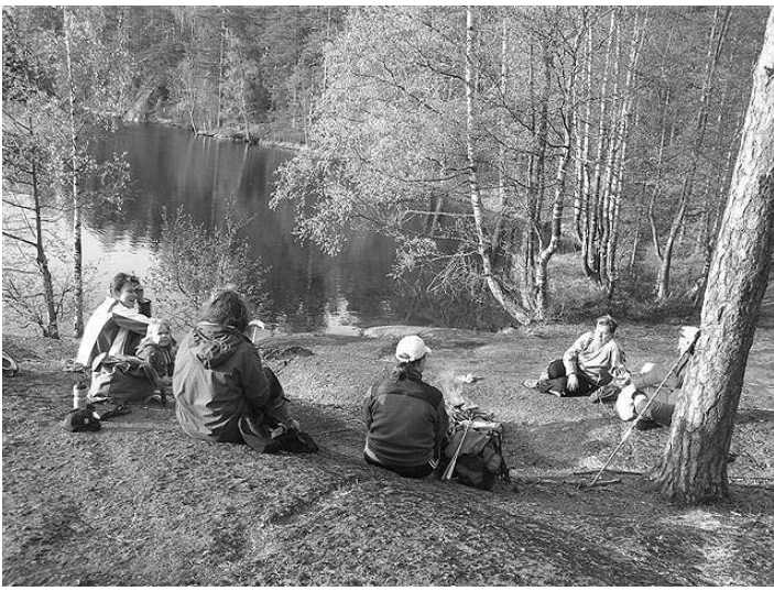
Niinimäen marttoja Järvenmäellä