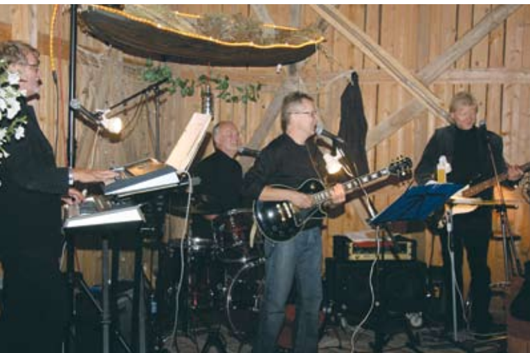
Opettajien orkesteri Sirius tahditti Niinimäen latotansseja