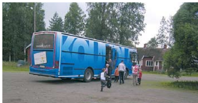
Kirjastoauto Regina pysähtyy Niinimäessä ja Teuroisissa.