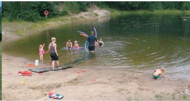
Heinäkuussa olikin sitten uimakoulun vuoro "vesipedot" nauttivat lämpöisistä keleistä ja leikeistä vedessä sekä rannalla.