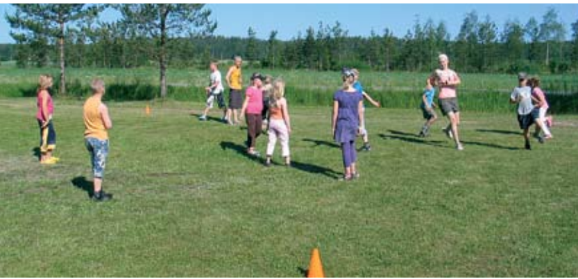
Kaupunki järjesti Teuroisten urheilukentällä kesäkuussa lasten liikuntaleirin, jossa oli kiitettävästi osallistujia.