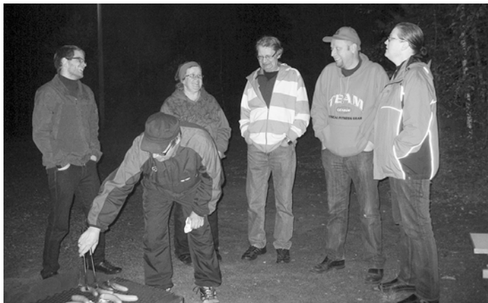
"Köyri-illan" viettoa Metsästysmajalla pe 11.10.2013.