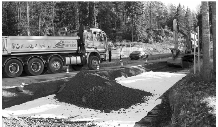
Maanantaina 14.10.2013 alkoi Kukonojantien päällystystyö Oivonojalta. Kylän miehet työn ääressä.