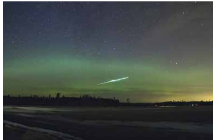
Meteoriitti 18.3.2015