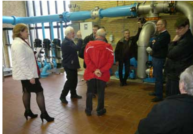
Tanskalaiseen osuuskuntaan tutustumassa