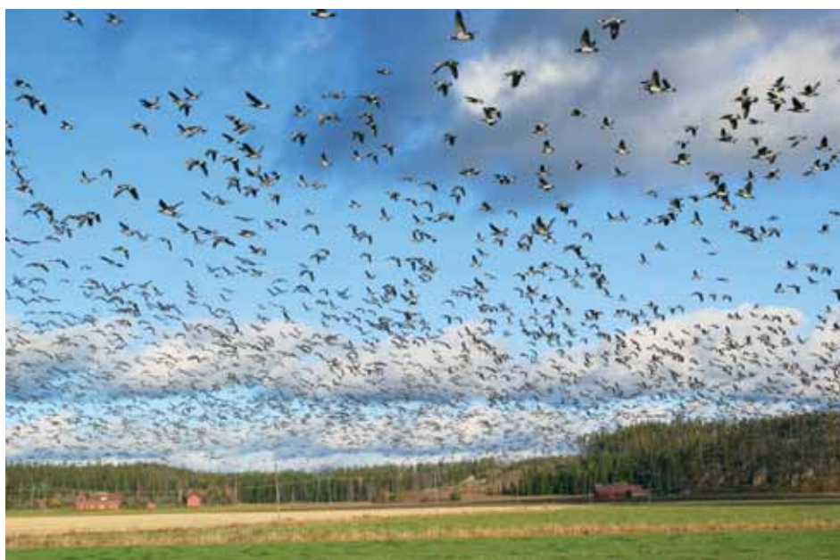
Syysterveiset Oivonojalta 22.10.2018.