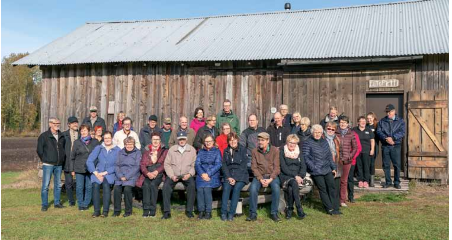
Kuvat: Rauni Pakkala