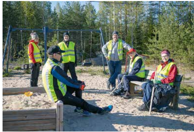
Hyvin suunniteltu on puoliksi siivottu.