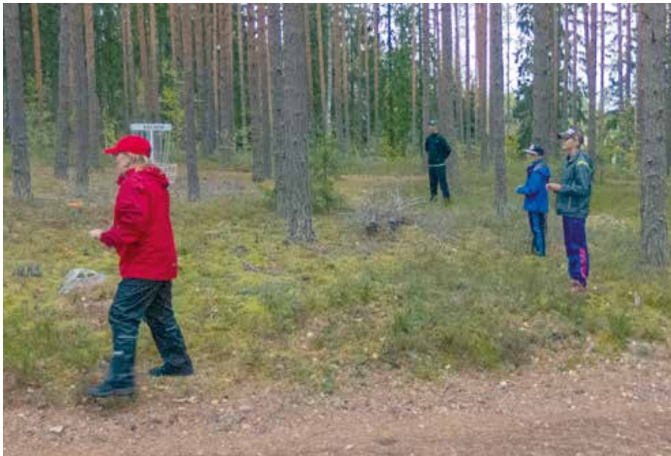
Frisbeegolfrata valmistui loppukesästä 2018. Radan yhdeksän väylää sijoittuvat vaihtelevaan, kaikenikäisille sopivaan maastoon.