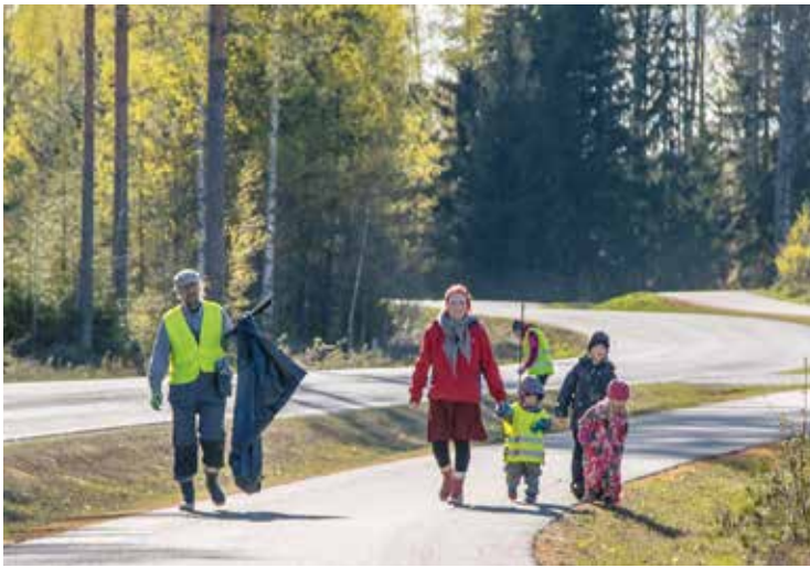
Kylän tienvieret ja pururadan ympäristö siivottiin talkoilla, kuvassa innokkaita talkoolaisia.