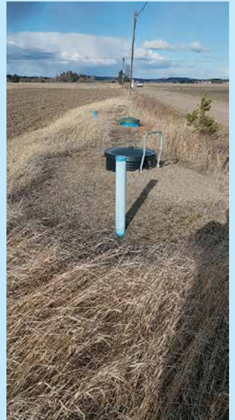
Kuvassa Myllyojan paineenkorotusaseman nuosutuet.

Osuuskunta pyrkii pitämään varaosa varas- ton siinä mitassa että on tarpeen tullen mis- tä ottaa. Osuuskunta on asentanut talven aika kolmeen mitta/valvontakaivoon put-