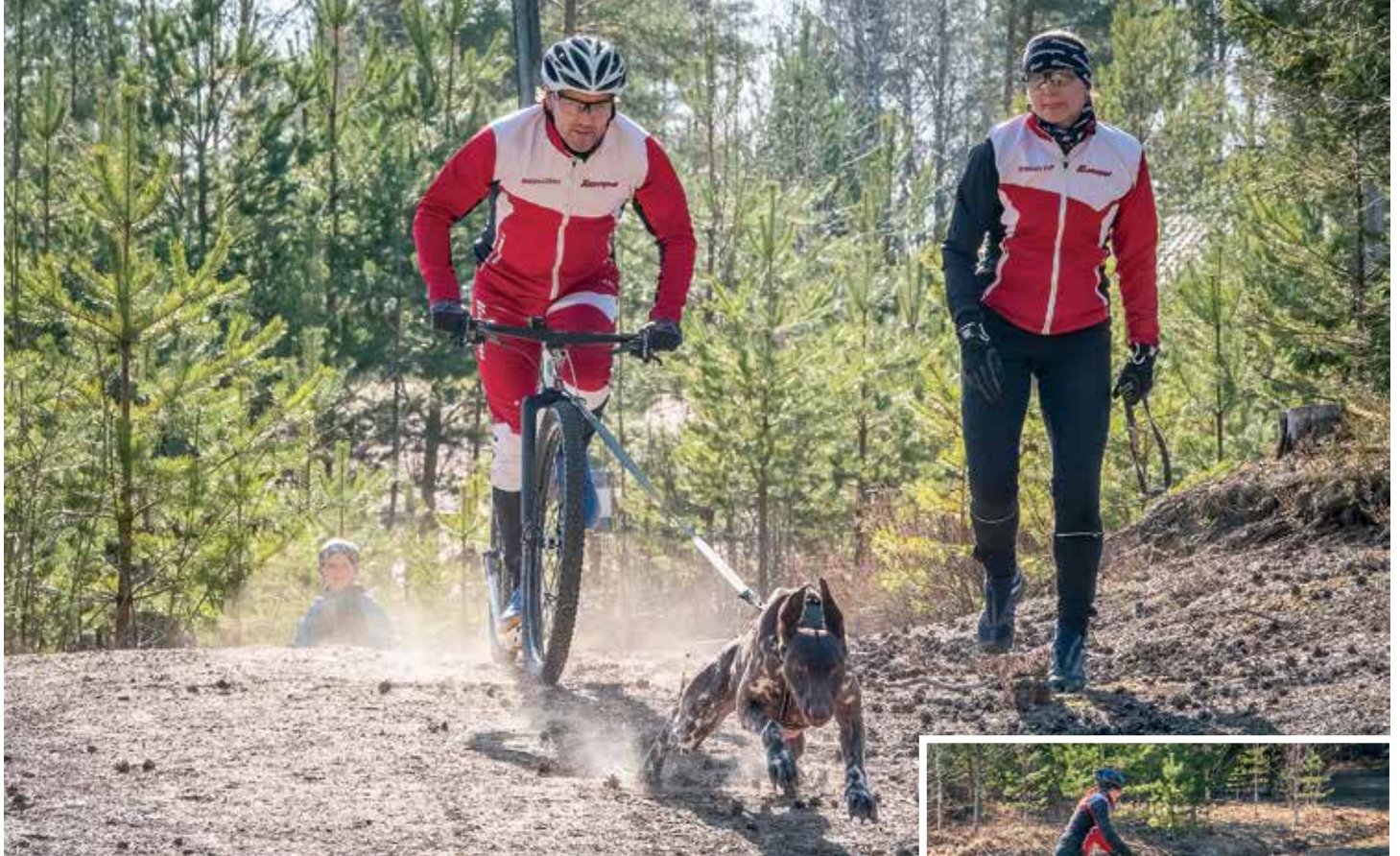
Liikkeelle lähtö on niin sähkökkä, että avustaja on tarpeen.