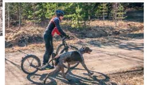
Sähköavusteisesta Kickbike potkulaudasta tulee jatkossa suosittu harrastusväline koiraväen keskuudessa, usko Immonen.

Ensikertalaiselle potkupyörä, kansainvälisemmin kickbike, on nopeasti sykettä nostava laite. Aloittaa kannattaakin tasaisemmassa maastossa kuin pururadalla. Pieni tekniikkakoulutus on hyväksi, ja Kainpon puolesta tämäkin onnistuu. Koronatilanteen helpottaessa on mahdollista järjestää jonkin tilaisuuden yhteyteen pyöräesittely, laajan malliston versiossa on riittävästi valinnanvaraa.