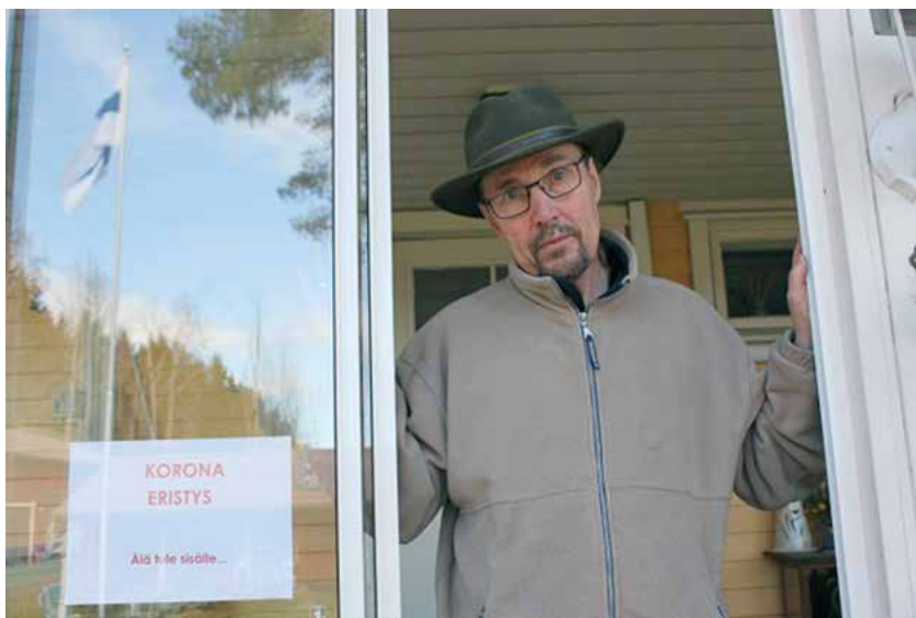
Koronaeristyksessä Vappuna 2021