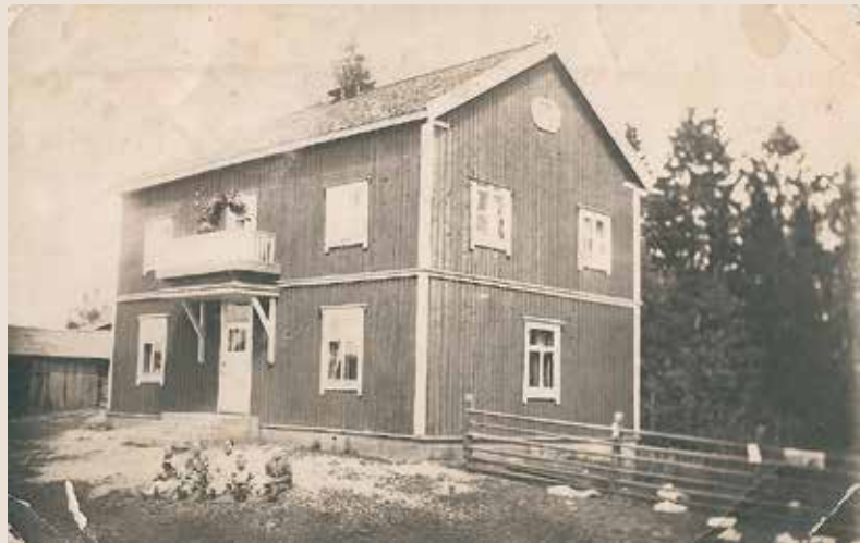
Uusi päärakennus poikkesi tyyliltään kylän muista taloista. Mäen päälle rakennettuna talon korkeus korostui, valaistuna näkyi kauas. Parveke oli tuohon aikaan harvinaisuus.