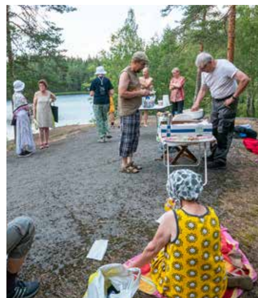
Martan päivää vietettiin lämpimässä kesäillassa Järvenmäellä