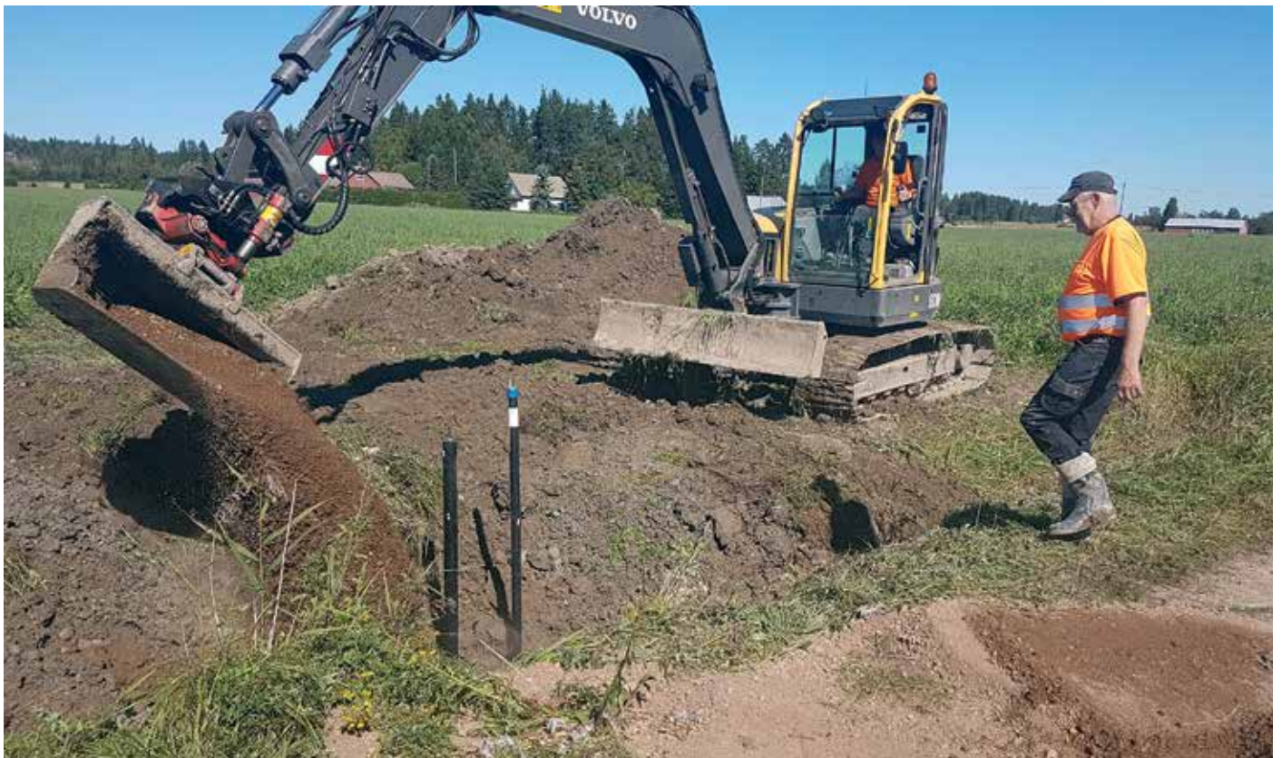
Linjasulkujen asennusta Hongistossa