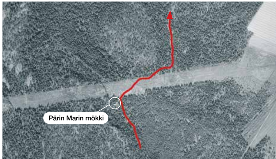
Ilmakuva vuodelta 1941 (kartta.paikkatietoikkuna.fi)

Kuulin lapsena kerrottavan että mökissä asui ”virolainen” mies talvisotaan asti, olisiko paikka tullut tutuksi jo kieltoajan aikaan? Kun sodan alussa venäläiset pommikoneet suuntasivat sähkölinjaa pitkin oli kallon päältä näytetty merkkejä, valoa (nuotio?). Mies hävisi ja valomerkit loppuivat.