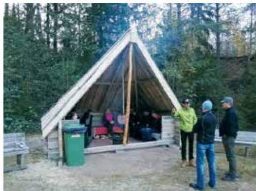
Laavun rakentaminen alussa.