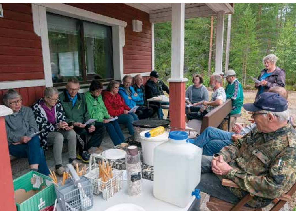
Martan-päivää vietettiin uhkaavan ukonilman vuoksi poikkeuksellisesti metsästysmajalla.